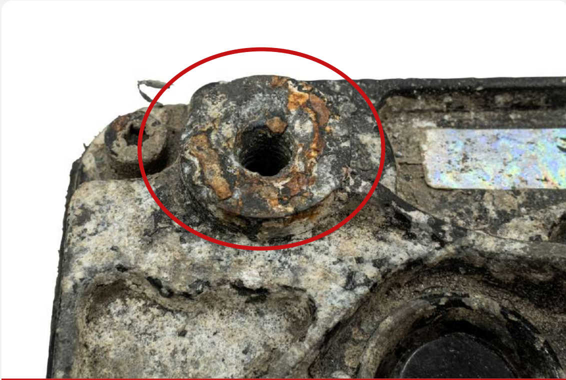
Uszkodzenia gwintów montażowych