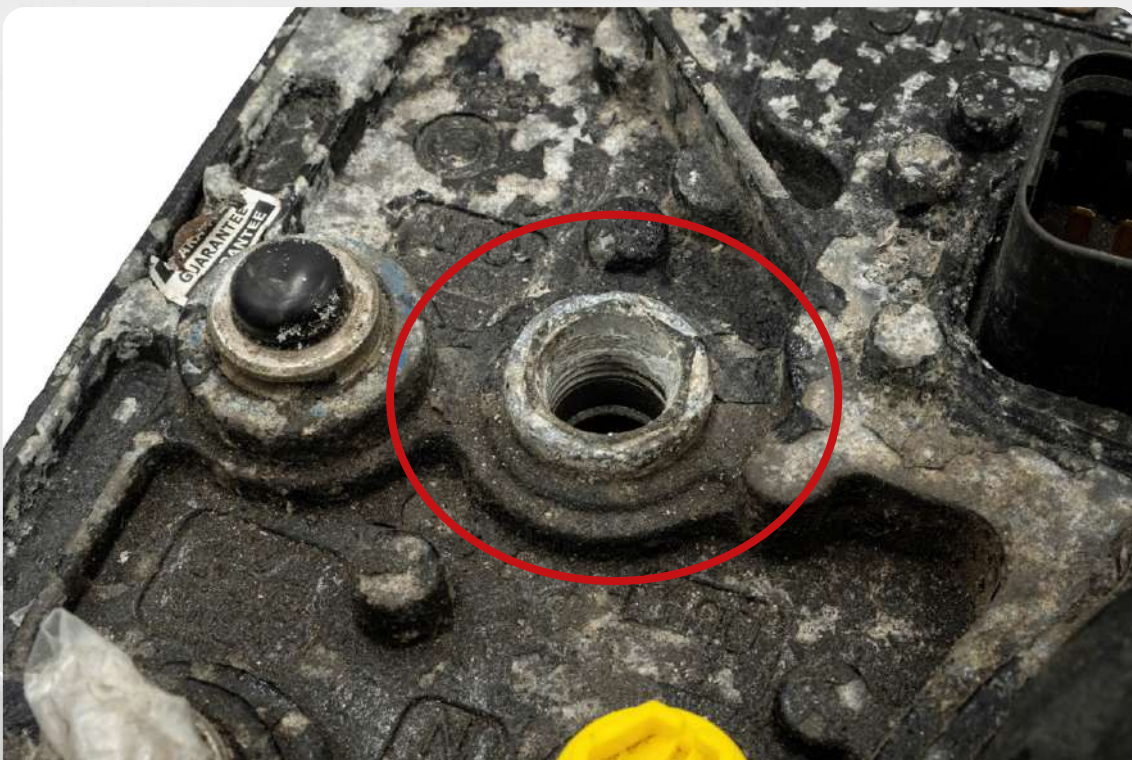
Uszkodzenia portów pneumatycznych