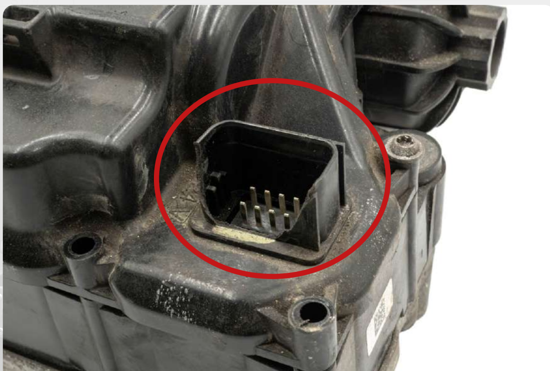
Uszkodzenia gniazda elektronicznego

Zwracane rdzenie zostaną odrzucone bądź zaakceptowane w niższej wartości, gdy wystąpią poniższe uszkodzenia.