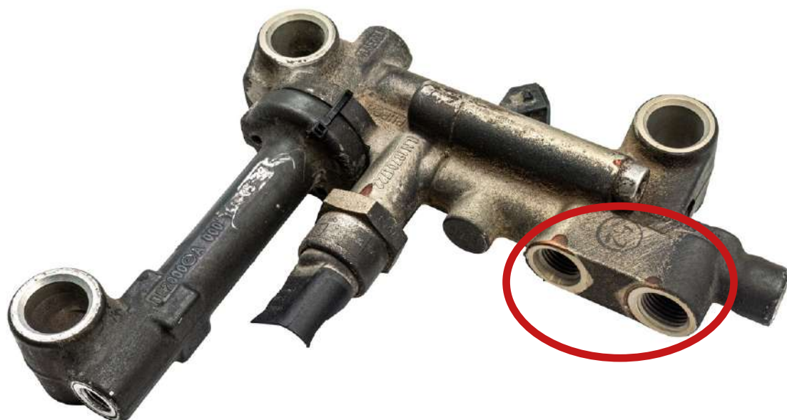
Rdzeń niekompletny *może skutkować obniżeniem kwoty zwrotu