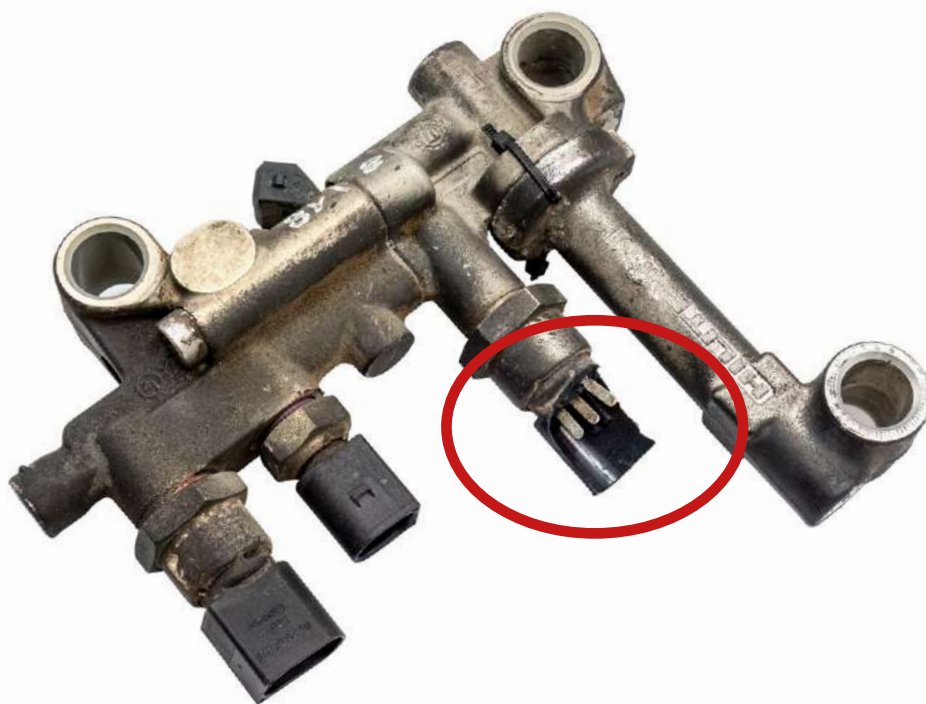
Uszkodzenie gniazda elektronicznego