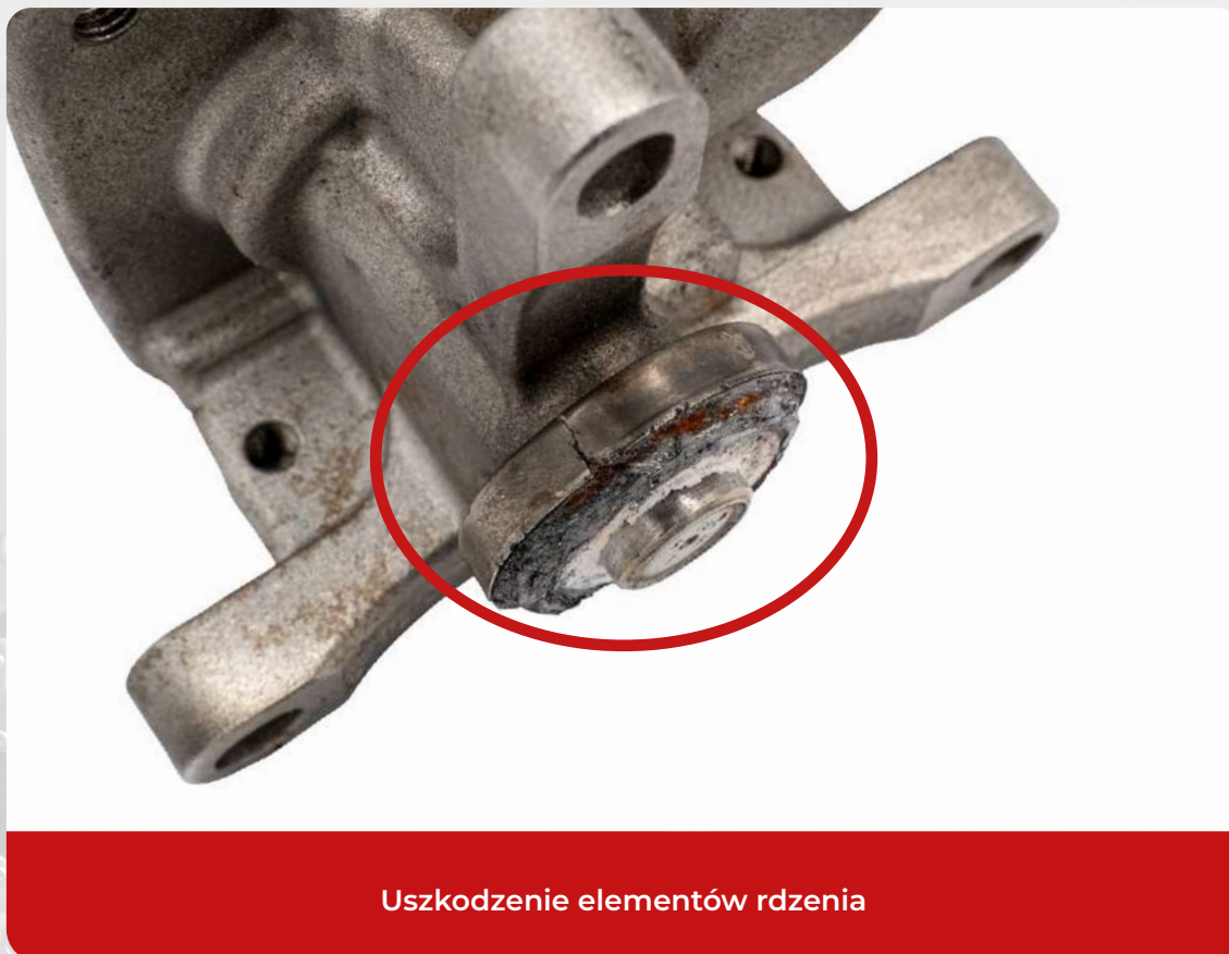
Uszkodzenie elementów rdzenia

W przypadku stwierdzenia uszkodzeń, rdzeń może zostać odrzucony lub jego wartość może zostać obniżona. Poniższe uszkodzenia mogą skutkować brakiem akceptacji rdzenia lub akceptacją w niższej kwocie.