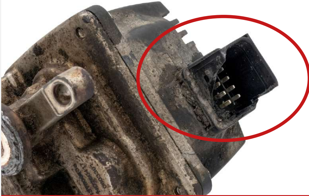
Uszkodzenie/utlenienie gniazd elektronicznych